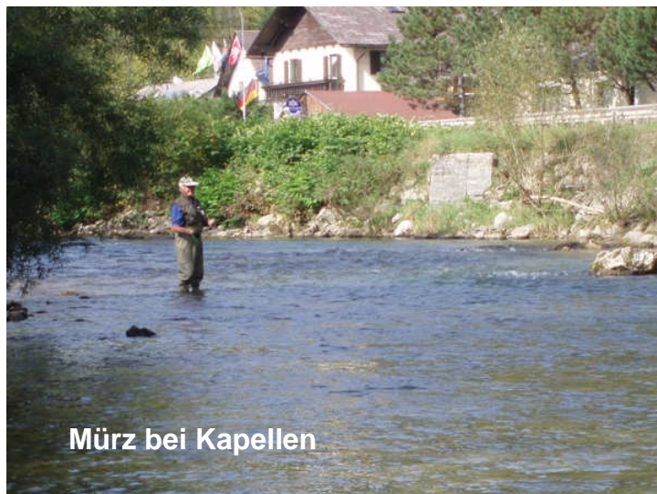
Mürz bei Kapellen