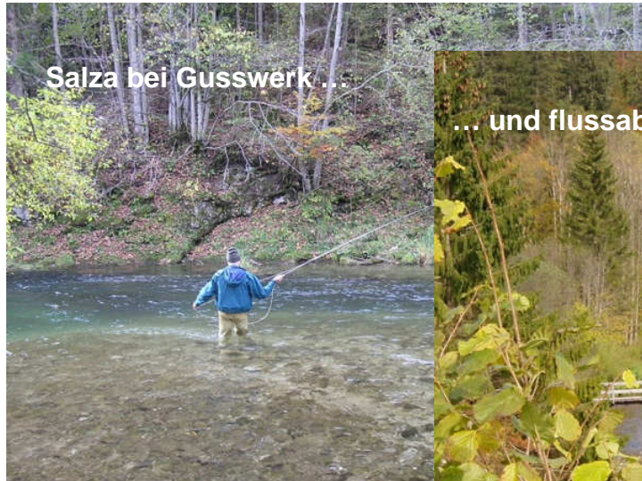
Salza bei Gusswerk...

Mürzsteg das ehemalige kaiserliche Jagdschloss) vorbei an den idyllischen Ortschaften Neuberg und Kapellen, um in Mürzzuschlag Fließrichtung nach Südwesten zur Mündung in die Mur bei Bruck zu nehmen. In ihrer Flusslänge nimmt sie Rang drei in der grünen Mark ein. Als die wichtigsten Zubringer bis Mürzzuschlag wären Dobrein- und Raxenbach zu nennen.