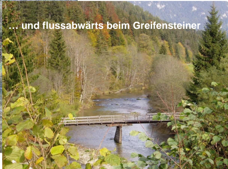
... und flussabwärts beim Greifensteiner