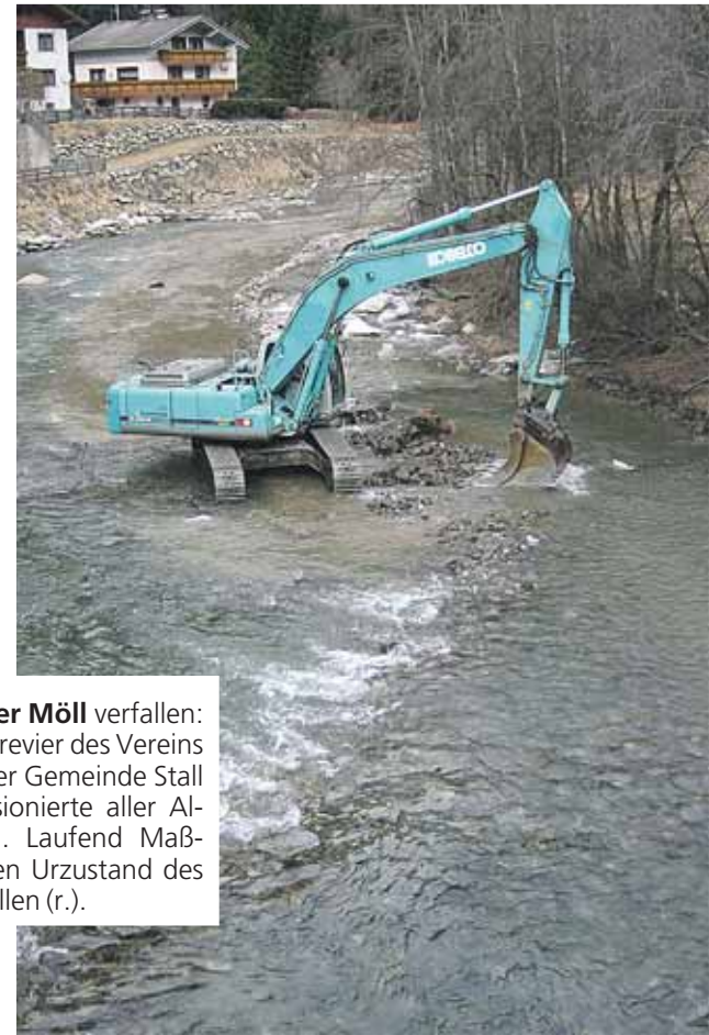
Dem Zauber der Möll verfallen: Das Fliegenfischrevier des Vereins Bachforelle in der Gemeinde Stall lockt Angelpassionierte aller Altersgruppen an. Laufend Maßnahmen, um den Urzustand des Flusses herzustellen (r.).