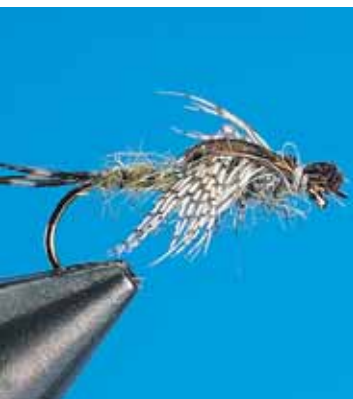
Selbst gebunden! Ist oft einfacher als die Qual der Wahl unter Tausenden Kunstfliegenködern.