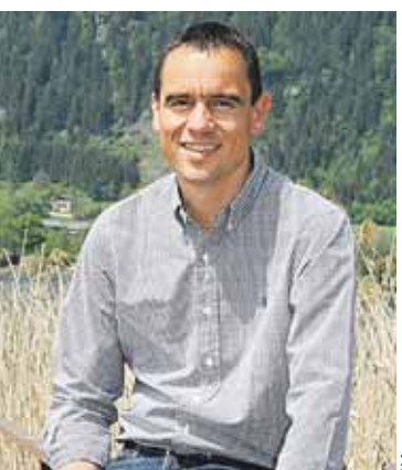
LHStv. Uwe Scheuch, Referent für die Fischerei und Naturschutz des Landes Kärnten.

Auf den Naturschutz und die Pflege dieses Gebiets sind die Fischer von Neudenstein sehr bedacht und achten im Zuge ihrer Kontrollen auch darauf, dass hier, wo ein strenges Einfahrts- wie Angelverbot gilt, dies auch eingehalten wird. Für den Einsatz möchte ich mich an dieser Stelle herzlich bedanken.