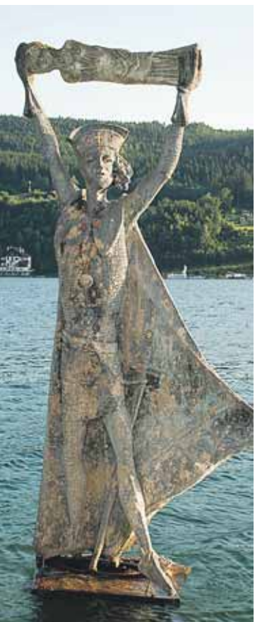
Die überlebensgroße Domitianstatue vor dem Schillerpark.